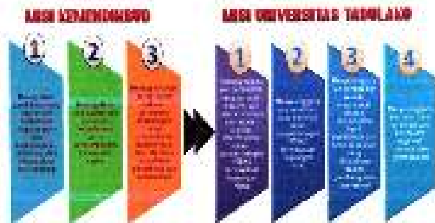
Gambar 1.2. Keseluruhan Misi Universitas Tadulako dengan Misi Kemendikbud

Fenomena Misi Universitas Tadulako adalah tugas dan kewenangannya, melaksanakan Misi yang sejalan dengan Misi Kementerian, yakni tertera pada Gambar 1.2.